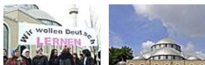
"Wir wollen Deutsch lernen": Frauen-Demo vor Moschee