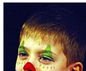
Schüler machen Zirkus Mit drei Zirkusvorstellungen der Extraklasse verzauberten die 170 Schüler... mehr